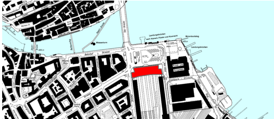
Bahnhof Restauration Luzern AG: Detailansicht